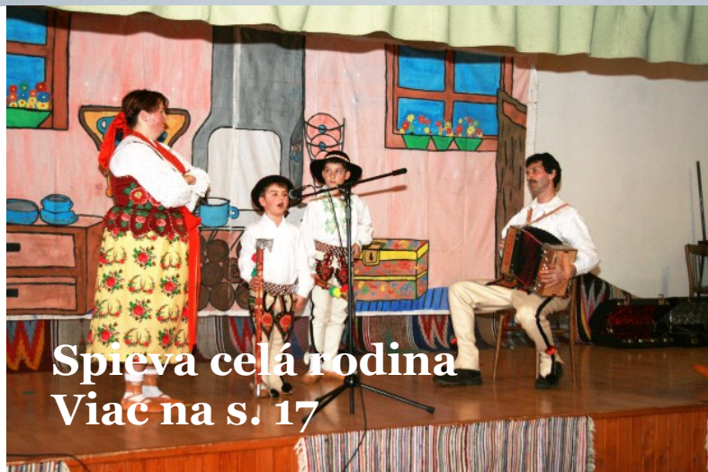
Spieva celá rodina Viac na s. 17