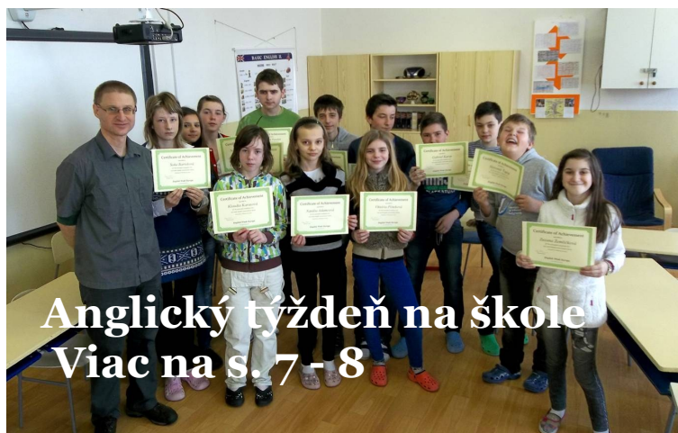
Anglický týždeň na škole Viac na s. 7 - 8