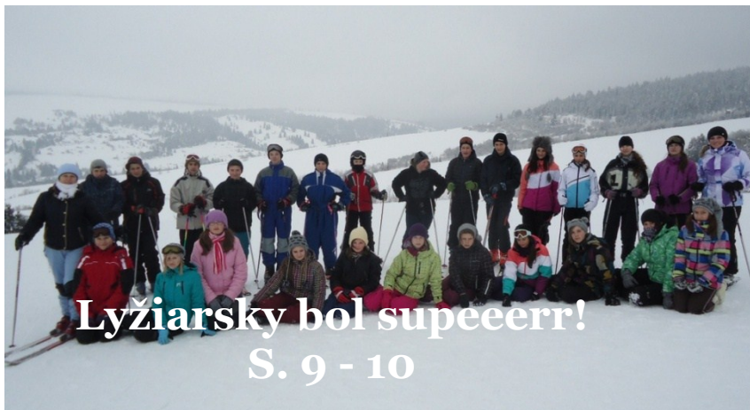
Lyžiarsky bol supeeeerr! S. 9 - 10