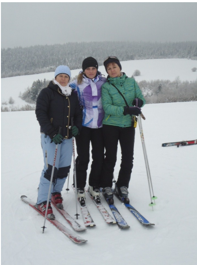
Pani učiteľky v plnej kráse počas lyžiarskeho výcviku