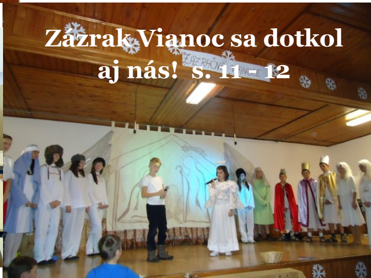
Zázrak Vianoc sa dotkol aj nás! s. 11 - 12